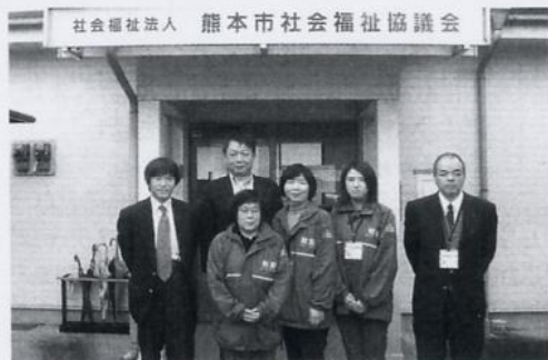
熊本市社会福祉協議会 市民相談課の皆様

地域福祉権利擁護事業は、社会福祉法で定められた「福祉サービス利用援助事業」のことを言い、ご自分で金銭や大切な書類を管理することに不安のある方の財産や権利を守るため、日常的な金銭管理や通帳・権利証等大切な書類を預かることを通して、 利用者が安心して地域で生活が送れるよう支援する事業でございます。 主として、県や各市町村の社会福祉協議会が当事業を実施しておられます。